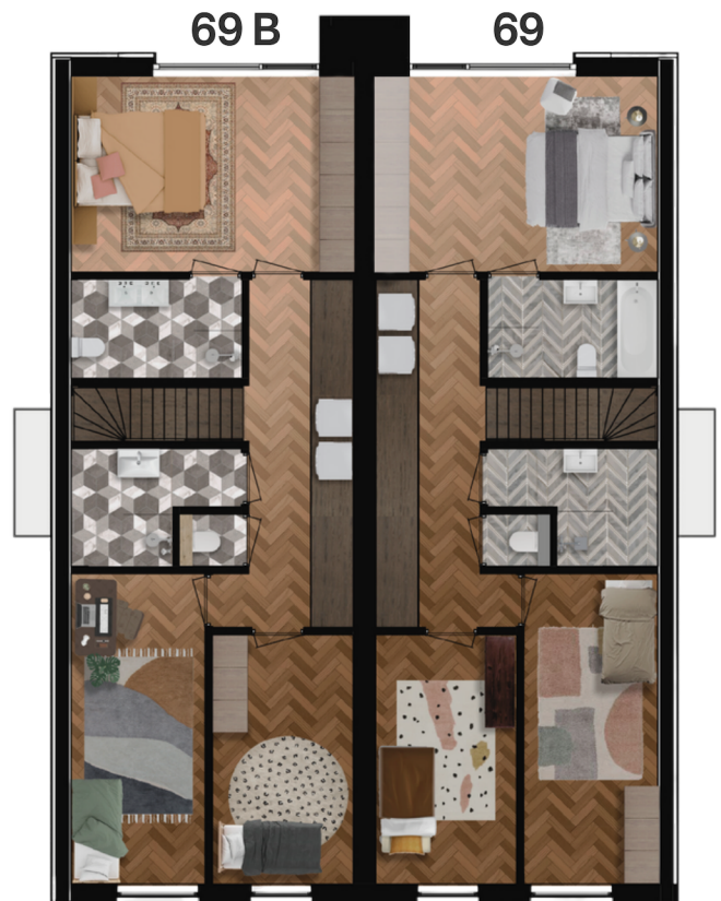
type B: gespiegeld